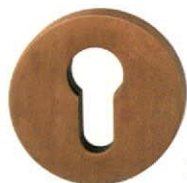
1102 Világos patinás bronz